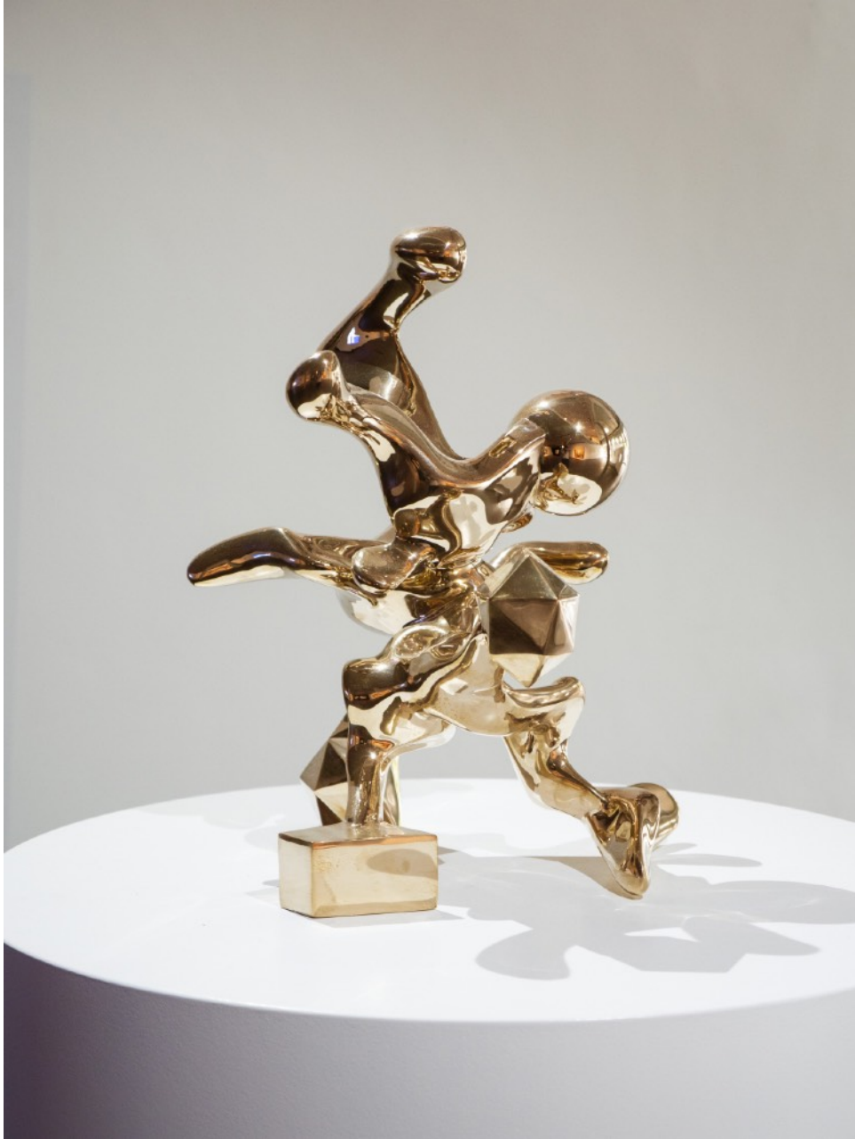
Infinity Polished Bronze 50 x 38 x 33cm 2022 © Filip Markiewicz