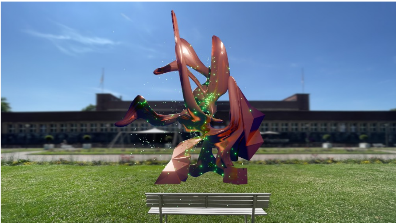
Infinite Modular Tree AR Animation (Simulation) 2022 link : https://vimeo.com/756134768/9e3297a7a6

Dieses digitale Skulpturenprojekt Infinite Modular Tree wird auch mit Klang verbunden sein, genauer gesagt mit der Komposition von Klängen aus modularen analogen Synthesizern, die es ermöglichen, eine Komposition zu schaffen, die auf zufällige Weise wie die Natur funktioniert.