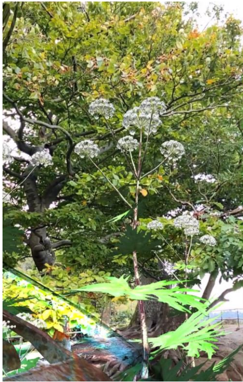
Screenshot mit Test App